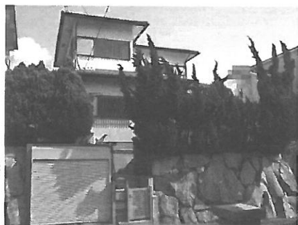
※増築未登記部分約15.396㎡含む